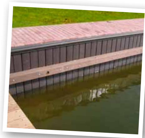
Functie en ruimte is het resultaat.

Van nieuwe walbeschoeiing knapt uw tuin niet alleen op, u voorkomt ook het wegspoelen van uw grond. Daarnaast krijgt u er in veel gevallen méér ruimte bij. Zo kan Snoek Hoveniers het aflopende talud naar het water opvullen. Het resultaat: meer vierkante meters tuin. Ook kunt u meer functionaliteit toevoegen door de aanleg van een veranda of een steiger.